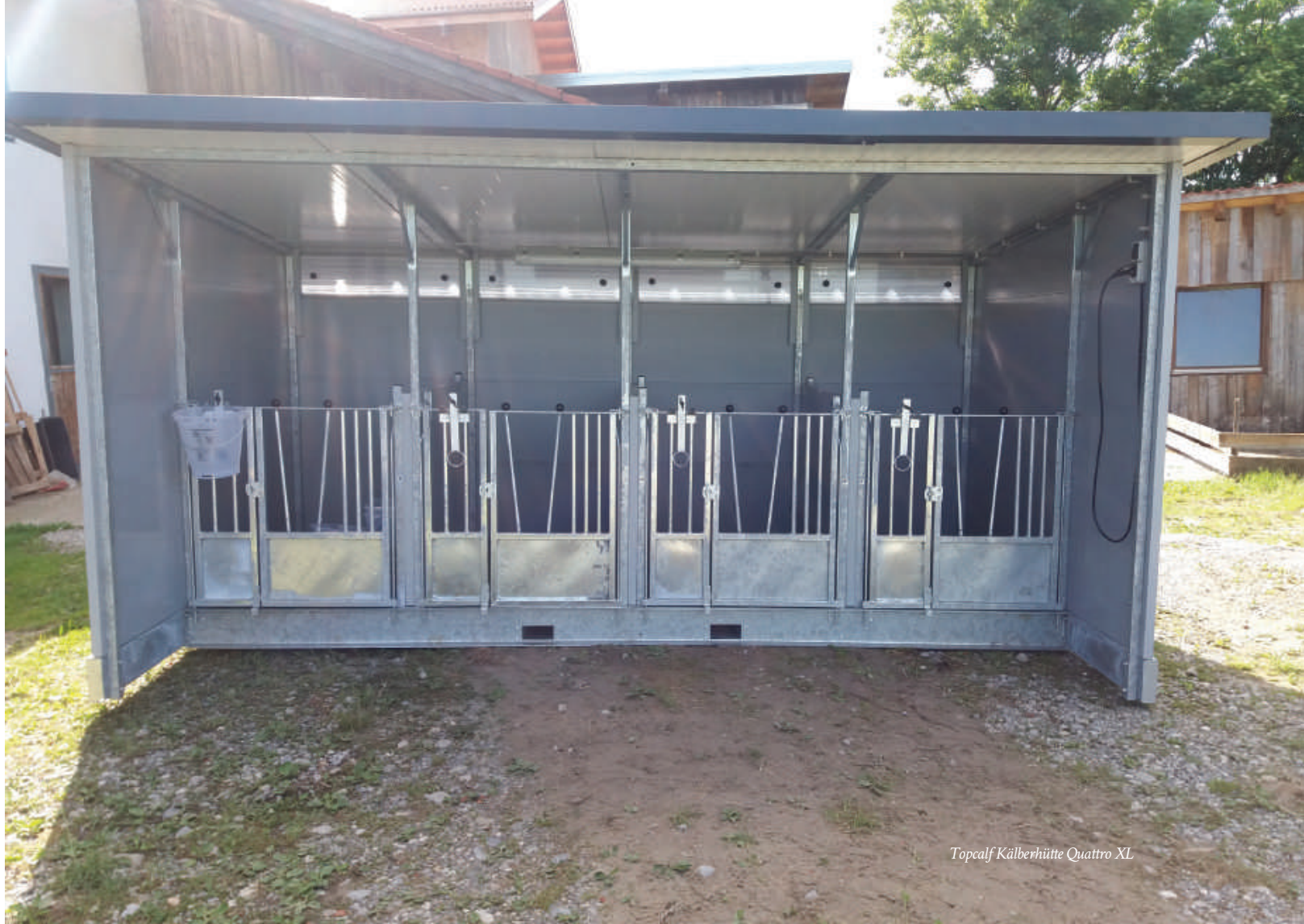
Topcalf Kälberhütte Quattro XL