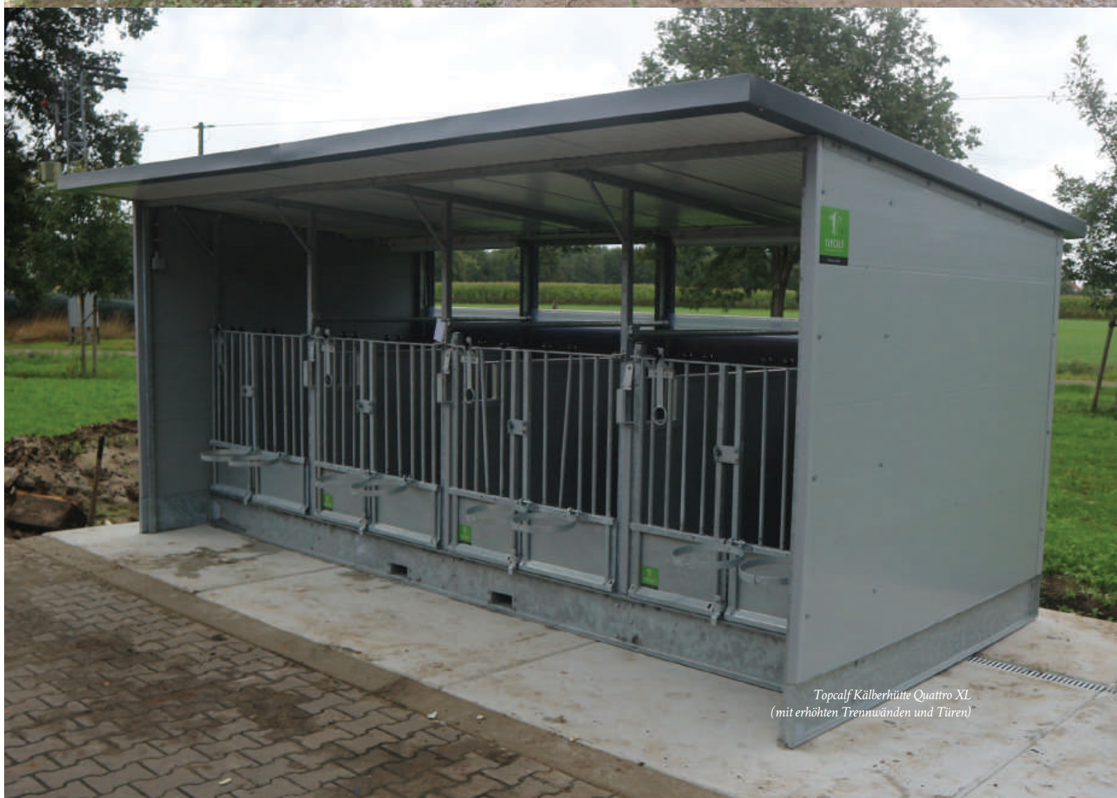
Topcalf Kälberhütte Quattro XL (mit erhöhten Trennwänden und Türen)